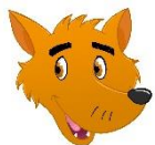
Illustration: Teresa Diehm