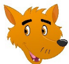
Illustration: Teresa Diehm